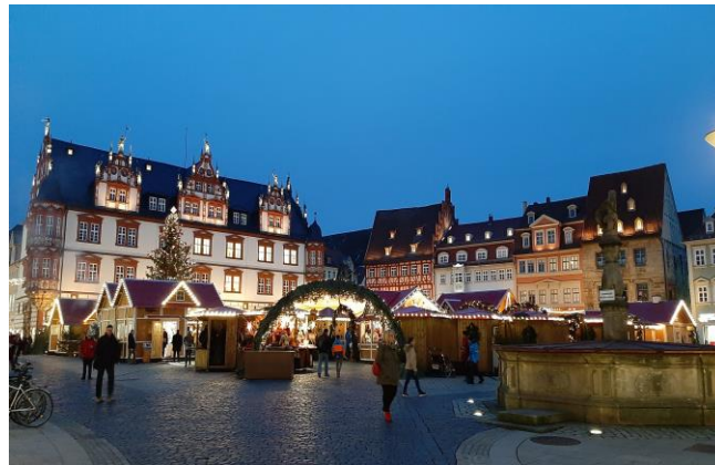
Weihnachtsmarkt mit der herzoglichen Kanzlei