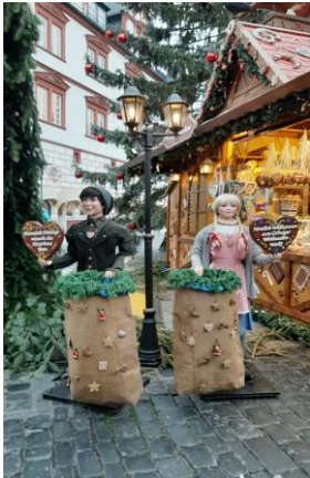
Begrüßung vor dem Hexenhaus

Gut ausgeschlafen fahren wir um 13:00 Uhr in Bayreuth los, mit 48 Personen geht es nach Coburg. Am Landestheater Coburg lässt Busfahrer Roland uns aussteigen. Nur ein paar Meter zu Fuß und wir befinden uns in der Innenstadt auf dem Weihnachtsmarkt. Bis zum gemeinsamen Abendessen im „Goldenen Kreuz“, haben wir genügend Zeit zum Bummeln und für ein Gläschen Glühwein oder eine Tasse Kaffee. In der Weihnachtszeit verwandelt sich der romantische Coburger Marktplatz, eingebettet zwischen historischem Rathaus und der alten herzoglichen Kanzlei, in eine kleine Weihnachtsstadt. In den liebevoll geschmückten Verkaufshäuschen rund um das Denkmal Prinz Albert werden viele einheimische Produkte angeboten. Glühwein, Deftiges, Süßes und Pikantes machen Appetit und manch einer von uns testet auch gleich die bekannten Coburger Bratwürste. Mit Anbruch der Dunkelheit verwandelt sich der Marktplatz mit seinen glitzernden Lichtern in einen der stimmungsvollsten Weihnachtsmärkte in Franken.