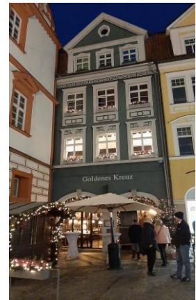
Abendessen im „Goldenen Kreuz“

Kurz nach 17:00 Uhr machen wir uns auf den kurzen Weg in das „Goldene Kreuz“ zum Abendessen. Dort sind Plätze in einem gemütlichen Innenhof für uns reserviert und wir genießen die Atmosphäre und das Essen. Auf dem Weg zum Landestheater wird es weihnachtlich, denn es hat es zu schneien angefangen.